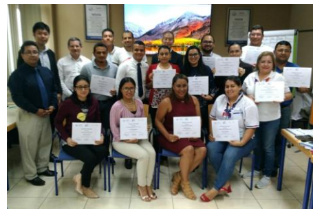
Capacitación del programa de emprendedores por FACACH para cooperativas involucradas