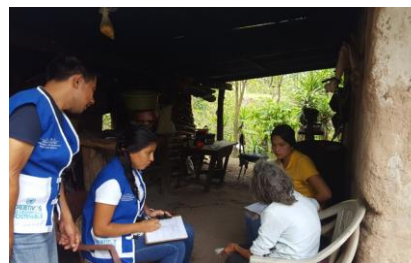
La aplicación de la encuesta de la evaluación en San Rafael del Depto. Lempira