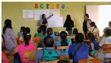
Participantes recibiendo la capacitación en Maraita de Francisco Morazán

Cabe mencionar que, desde mayo, se ha comenzado el estudio de evaluación adicional para monitorear los avances de los hogares participantes y determinar la metodología simple para el monitoreo de los hogares.