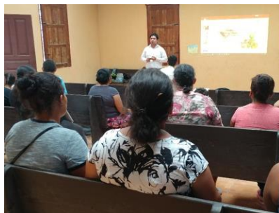
Una cooperativa en colaboración con la municipalidad ofrece educación financiera (Talanga, Depto. Francisco Morazán)