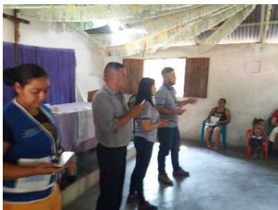
Una institución microfinanciera, ofreciendo la capacitación de manera coordinada con la municipalidad de Quimistán (Depto. Santa Bárbara)

Cabe mencionar que no sólo las entidades públicas sino también sectores financieros y cooperativas aplican el Modelo ACTIVO con miras a la inclusión financiera y económica, como las siguientes fotos presentan.