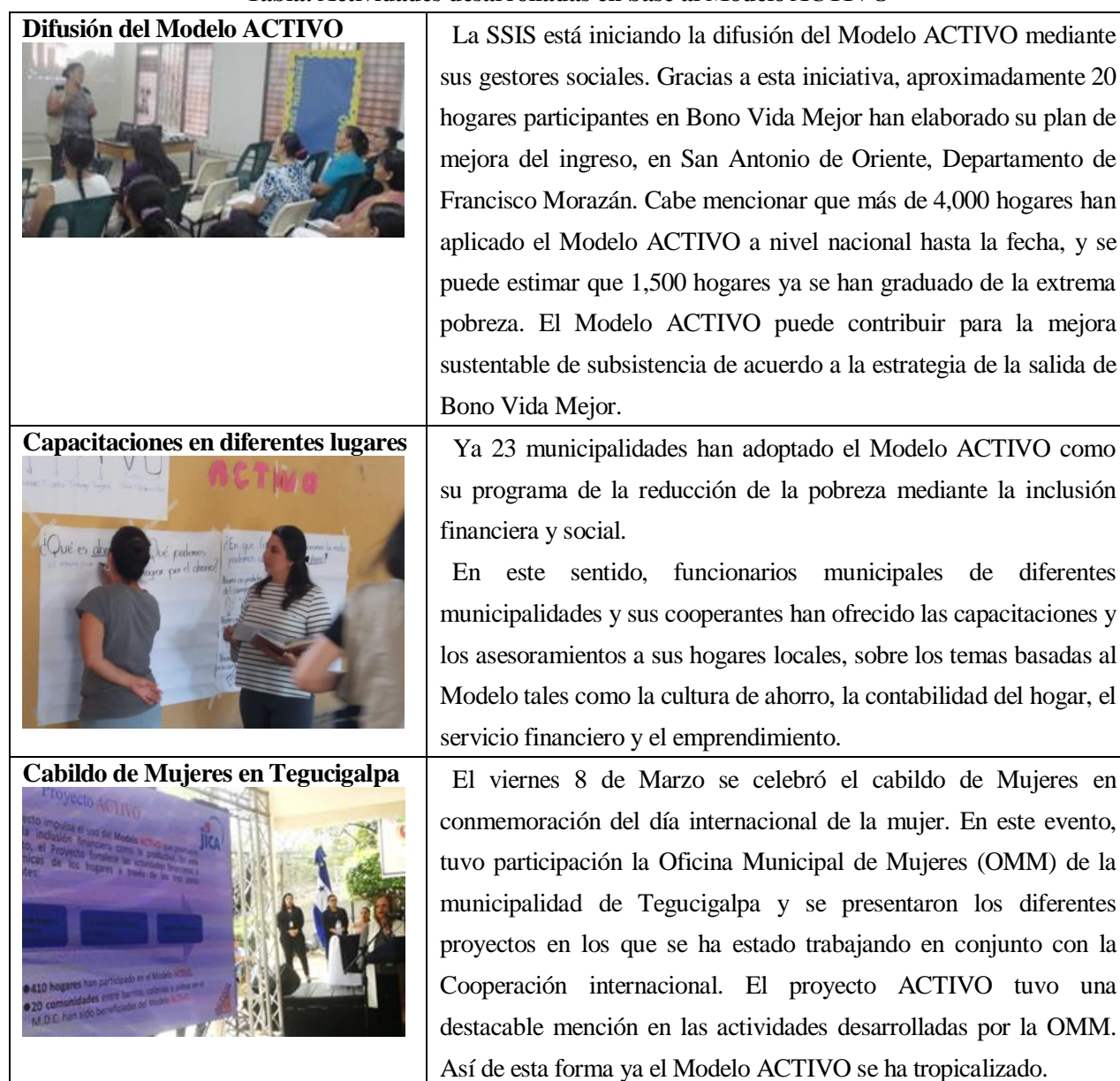
Tabla: Actividades desarrolladas en base al Modelo ACTIVO

En el mes marzo, las siguientes actividades se han implementado con miras a la reducción de la extrema pobreza basada en el Modelo ACTIVO.