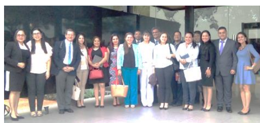
Visita al Banco Central de Paraguay

Se realizó el cuarto curso internacional en Paraguay entre el 17 y 23 de marzo, invitando a los participantes de las entidades hondureñas públicas; tales como SSIS, Banco Central (BCH), Comisión Nacional de Bancos y Seguros (CNBS) y Consejo de Supervisión de las Cooperativas (CONSUCOOP), y las privadas; incluyendo Federación de Cooperativas de Ahorro y Crédito de Honduras (FACACH), Asociación Hondureña de Instituciones Bancarias (AHIBA), Centro de Procesamiento Interbancario (CEPROBAN) y los otros. El objetivo del curso fue conocer la experiencia de Paraguay para fomentar la inclusión financiera y social en Honduras, mediante aprendizaje sobre (i) bancarización en la zona rural, (ii) desarrollo de productos y servicios financieros apropiados a los pobres, incluyendo la moneda electrónica móvil, y (iii) programas de inclusión social y financiera.