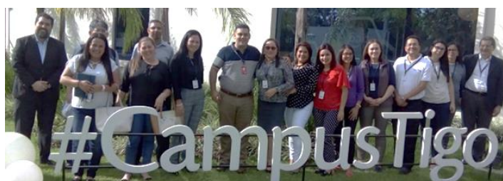
Visita a Tigo Paraguay para discutir de la moneda electrónica