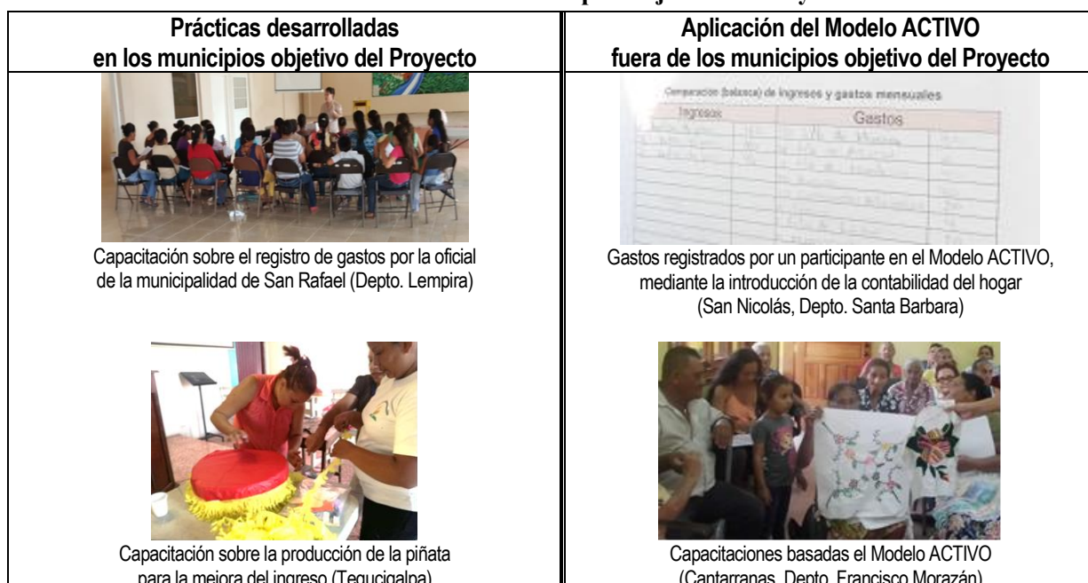
Tabla 1. Actividades desarrolladas tanto en los municipios objetivo del Proyecto ACTIVO en los otros

El Modelo ACTIVO se ha aplicado principalmente en los cinco municipios objetivos del Proyecto (San Rafael en Lempira, Quimistán y Las Vegas en Santa Bárbara, La Villa de San Francisco y Tegucigalpa en Francisco Morazán), y hoy día se está iniciando la aplicación del mismo en los otros municipios por su propia voluntad. Las actividades desarrolladas en diferentes municipios en el mes agosto se presentan abajo.