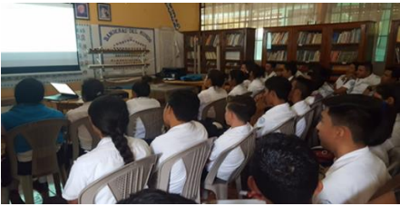
Formación de la cultura de ahorros por una cooperativa de ahorro y cuenta participante en el Modelo ACTIVO

Cabe mencionar que diferentes entidades financieras están participando en el Modelo ACTIVO para mejorar la oferta de productos y servicios financieros apropiados a los pobres, como las siguientes fotos presentan.